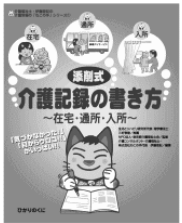
『介護記録の書き方』

『介護記録の書き方』～添削式・在宅・通所・入所～介護業界の出版本では異例の大ヒット！1万部突破！！